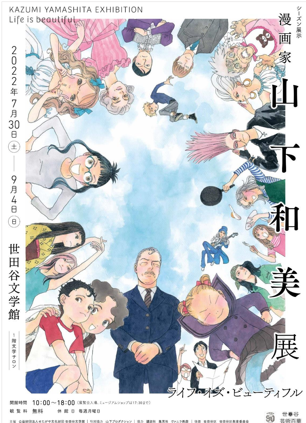
画像1：展覧会メインビジュアル