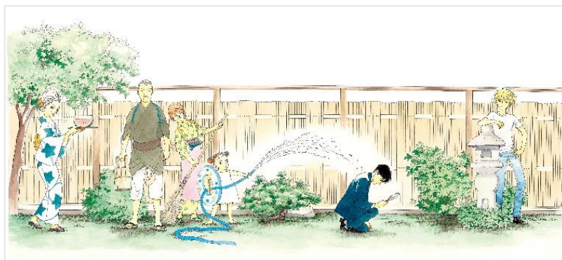
画像7：『続・数寄です!』原画©山下和美