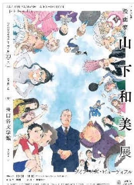
画像1：展覧会メインビジュアル