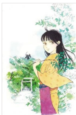
画像5：『ランド』原画©山下和美