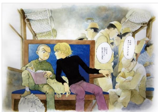
画像4：『不思議な少年』原画©山下和美