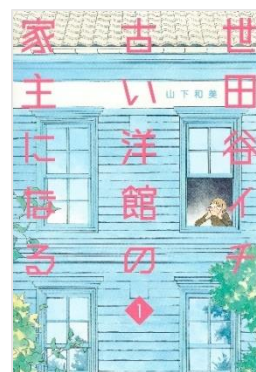
画像6：『世田谷イチ古い洋館の家主になる』1巻表紙（集英社、2021年）