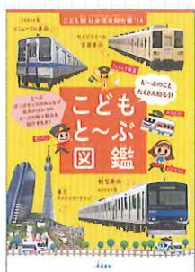
子ども版社会環境報告書